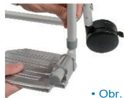
• Obr. 4

Opěrka nohou pro sprchovou židli lze nastavit podle různých požadavků. Musíte zatlačit zajišťovací svorku (Obr. 4) ne méně než 6,5 cm od úrovně podlahy. Ujistěte se, že obě opěrky jsou zajištěny ve stejné výšce.