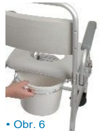
• Obr. 6

Používejte toaletu pouze když je křeslo v klidu. K použití toalety odstraňte vyjímatelnou část sedadla pomocí rukojeti na přední části. Toaletní mísu vyjměte pomocí rukojeti. (Obr. 6).