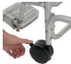
• Obr. 5

Páka brzdy musí zajistit kolo. V případě nutnosti zkontrolujte tlak brzdících členů. V případě potřeby nastavte dotáhněte příslušnou matku.